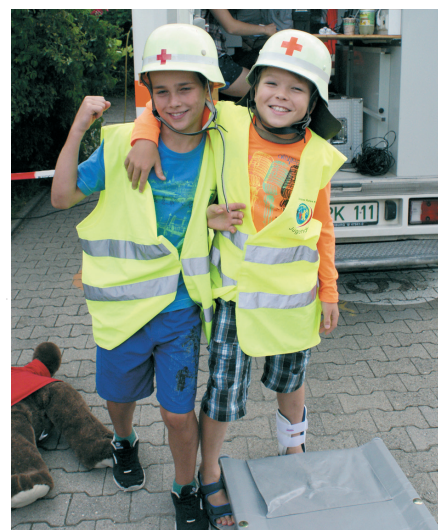
Schulsanitätsdienstag 2015 auf der Insel Reichenau